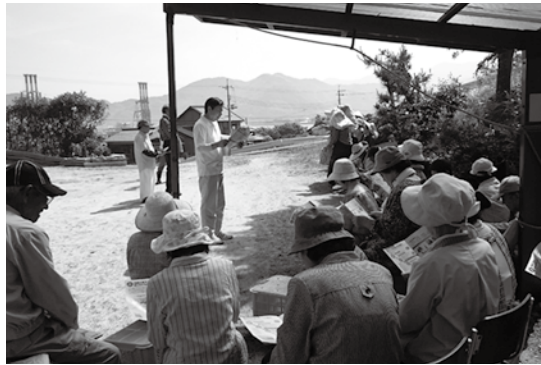
▲地域で行われている防災訓練