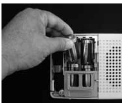
②単2の電池(アルカリ電池推奨)が4本必要です。

受信機の右側面のスイッチを切って、前面のふたを開け電池を入れ替えます。電池の交換が終わりましたら元に戻し、コンセントなどを確認してスイッチを入れます。前面の『乾電池』赤色のランプが消えて緑色のランプが点灯していれば電池交換の終了です。