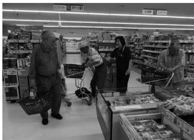
▲買物サロン実施中 介護予防サロンの帰りに町内のスーパーで買物サロン♪ 今日の晩ご飯は何にしましょうか？

周防大島版 CCRC ネットワーク推進事業についてのお問い合わせ 介護保険課 ☎0820 (73) 5503