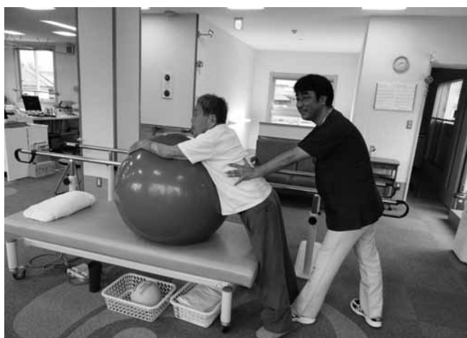
▲短期集中予防サービスの様子 おげんきクリニックで理学療法士さんとマンツーマンでリハビリ