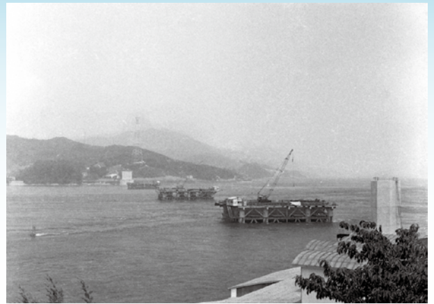
架橋工事中 1974年8月

昭和51年(1976年)の大島大橋の開通によって人・モノ・情報の流れは大きく変化しました。今年は大島大橋の開通から40年にあたります。大島大橋の開通は長年の悲願であり、熱心な住民運動の成果によって架橋が実現しました。