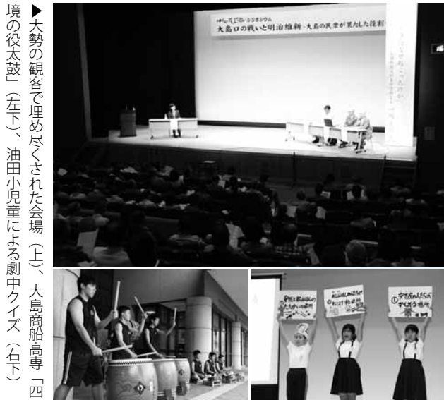
▶大勢の観客で埋め尽くされた会場（上）、大島商船高専「四境の役太鼓」（左下）、油田小児童による劇中クイズ（右下）