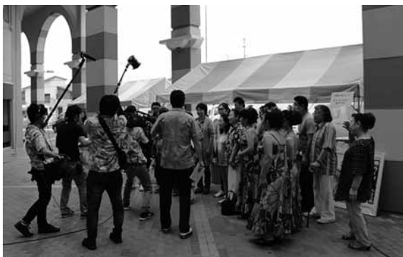
▲周防大島フェアは「ちぐまや家族」で生中継されました。

自宅作曲である「バリバリの浜辺」が頭の中から離れない位に自主練を重ね、迎えた当日。ステージでは上手く踊れたかどうか覚えていない程緊張しましたが、とにかく楽しかった!みなさんがフラをする気持ちが少しわかった気がします。普段は気さくなハラウ・オ・カマイレさん達ですが舞台に立つと笑顔や立ち振る舞い、雰囲気は更に女性らしくなり本当に素敵です。 サタフラ2016は7月16日から8月27日の毎週土曜日にグリーンステイながうらやH&Rサンシャインサザンセト等の会場でご観覧頂けます。 さて、次回の海掃除は7月20日(水)午後5時から真宮島で、8月8日(月)午後5時から日前の白鳥が浜行います。大島を訪れる観光客の方々に気持ちよく過ごして頂けるよう皆様のご協力をお願いします。