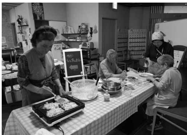
▲介護予防サロンええあんばいの様子 お好み焼きですかね？料理を作っています