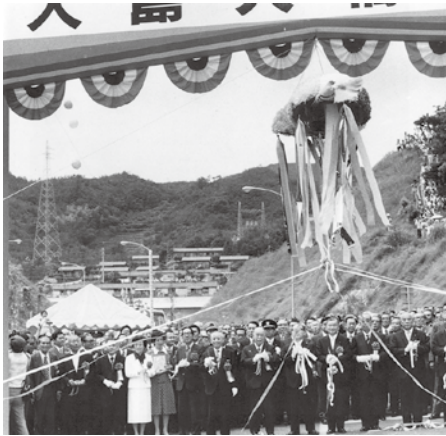
大島大橋開通式 1976年7月4日