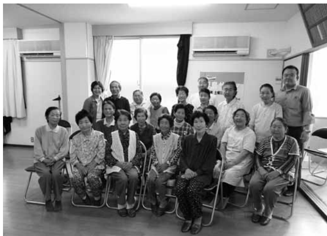
▲浮島サロンへの参加者 5月28日から樽見公民館でスタートした浮島サロンは18人の参加がありました

周防大島版CCRCの実現のため、町内の各地で介護予防サロン、認知症予防サロンが始まりました。また、送迎時には買物サロンを実施し、高齢者自身が物を見て買うという介護予防と低栄養防止に資する買物弱者対策も行います。このほか、地域住民や移住者が社会参加しながら生活支援サービスが利用できるようコーデイネーターを設置し、地域資源を総動員しボランティアを養成します。また、介護の重度化の予防を目指し、リハビリテーション専門職による短期集中予防サービスも始めました。これにより、地域住民との一体性や継続的ケアを確保するとともに、新たな雇用を創出することで、ひとの流れの加速化を目指します。