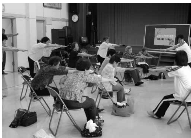
▲元気アップサロン椋野の様子 やまぐち元気アップ体操で健康維持