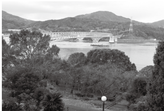
▲遊歩道の整備などが計画される瀬戸公園