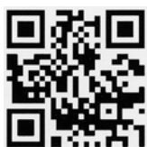
登録・変更専用QRコード