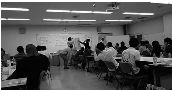
▲班に分かれてグループ発表している様子

きたことは今後活動していく上で大きな原動力になります。そしてなにより協力隊として「地域で楽しく暮らすこと」というシンプルなことが一番大切ということに気づけた研修でした。 さて、次回の海掃除は7月20日(水)午後5時から道の駅サザンセトとうわの沖に浮かぶ真宮島で行います。掃除に必要な道具類はこちらでご用意致しますので動きやすい服装でお越しください。