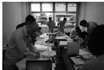
▲御船町役場にて罹災証明の事務を進める

保険や公的支援の手続きには罹災証明が必要だが、被害調査は1日で40戸（1チーム）が精一杯の状況だった。 道路はおおむね通行でき、水道や電気もほぼ復旧している状況で、店舗も営業を再開していた