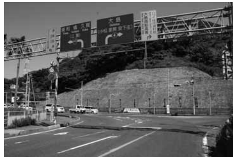
▲サイン看板設置予定の大島大橋南詰

大島大橋南詰法面にサイン看板、各観光施設入口にランドマークとしての機能を持たせた共通型のLED看板を設置します。