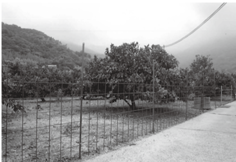
▲イノシシ防護柵の一例

農業の担い手を確保するための新規就農支援として、新規就農者育成に対する総合的な支援を行うための給付金を交付します。