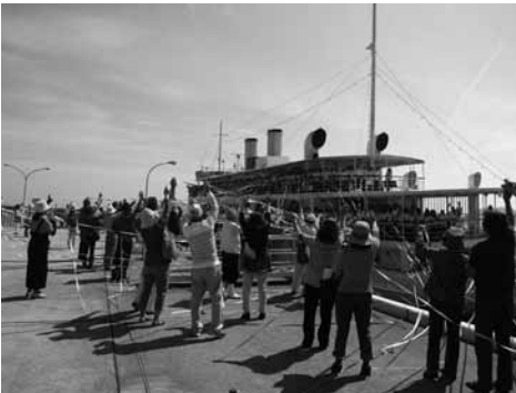
▲体験型修学旅行見送りの様子