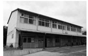
田布施農業高等学校大島分校閉校校舎跡地