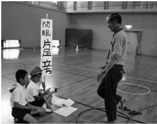
▲地域の方の体力測定をする島中っ子

島中小では、臨海教室や昔の遊び、カルタ・百人一首、門松・しめ縄作り等、定期的に地域との交流活動を行っています。写真は、毎年6月に実施する、地域の方を対象とした体力測定です。握力、長座体前屈、背筋力、立ち幅跳び、ソフトボール投げ、開眼片足立ち等の測定を行います。書写の時間に毛筆で書いた表示や手作り名簿等、主体性を尊重し子ども中心に活動しています。「子どもは地域から知恵をいただき、地域は子どもから元気をもらおう」と同時に、学校も地域づくりに一役買っています。 笑顔が溢れ、穏やかな時間が流れる「島中ふれあいタイム」です。