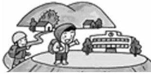
避難所・避難経路の確認

http://www.town.suo-oshima.lg.jp/soumu/dosya_saigai_1.html