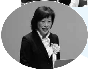
▲「体を動かすことを面倒くさがらないで、少し不便な生活を取り入れて」と笹原先生