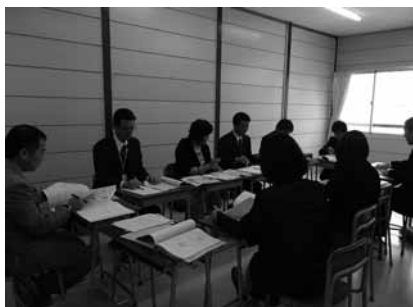
▲合同研修会の様子

4月6日に第1回中高合同研修会が行われました。この会では新着任者も含めた中高すべての教員が集まりました。全体会では、少子化・人口減少などが大きな課題となっている周防大島において、地域コミュニティの維持や地域の活性化に向けては、中高が一体となった教育活動が重要な役割を果たすことを改めて全員が確認しました。