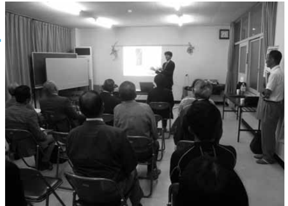
▲ふるさとと子どもたちの未来を語る「地区懇談会」

学校と地域の今と未来を語ることは、ふるさとの、そして子どもたちの未来と希望を語ることに他なりません。今回重ねられた熱心な対話は、今後大きく活かされることと思います。