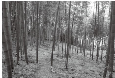
▲きれいに整備された竹林

タケノコの収穫に繋げたり、竹を利活用した新たな試みを模索するため、荒廃竹林をモデル的に整備し中山間地域の環境を整備します。