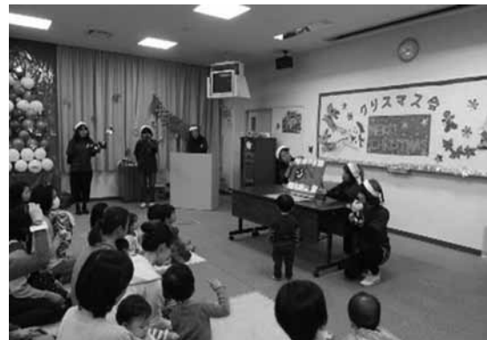
▲昨年12月3日に開催されたクリスマス会で「はみがきのうた」の紙芝居をしている様子

私たち母子保健推進員（母推）は、3歳6か月健診でむし歯のなかったお子さんの表彰（むし歯ゼロっ子表彰）を、クリスマス会（交流会）やおたのしみ会で行っています。クリスマス会ではむし歯予防に関する紙芝居や劇などをしながらむし歯予防に取り組みんでいます。むし歯予防には、おやつ時間を決めて与えたり、仕上げ磨きをすることも大切と言われています。子供用の歯間ブラシやフロスなどを使って大人が上手に手助けをしてお子さんの歯の健康を守りましょう。