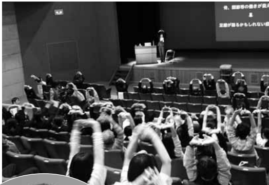
▶座ったままできる運動も紹介されました

また、講演に先立ち、東和中学校の生徒さんが「学校における『ちよび塩』活動」の取り組みの報告を行いました。（詳細は10ページに掲載）