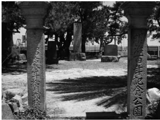
▲明治百年記念公園（周防大島町久賀）