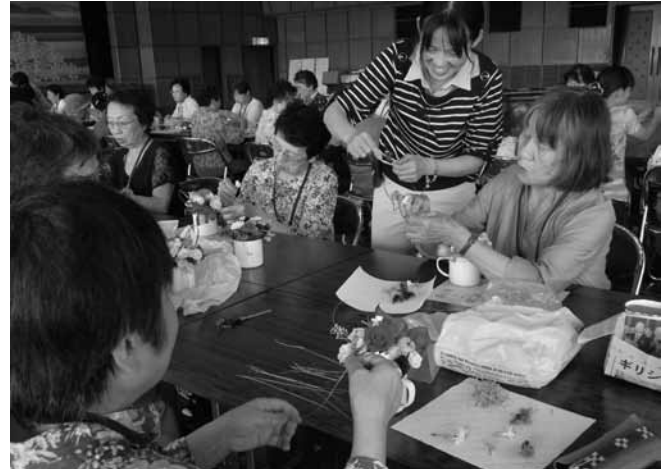
昨年度の生涯学習講座の様子

大島公民館 ☎ 74 - 3800 F A X 74 - 3999 oshimakoyoi@town.suo-oshima.lg.jp