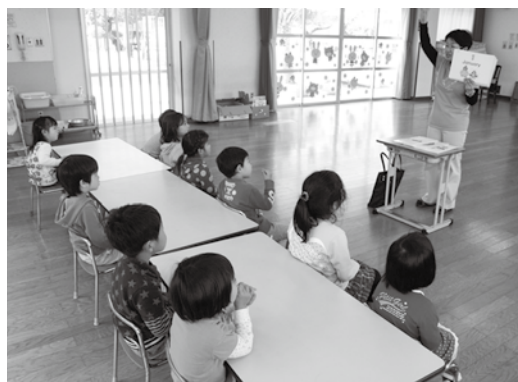
▲保育所英語講師派遣事業