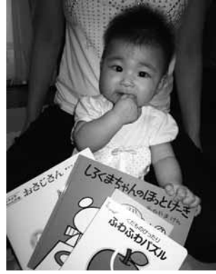
▲読み聞かせサポート事業

子どもたちが心豊かに育つことを願って、生後6カ月の乳児にファーストブック（絵本）を、保育所に絵本と紙芝居を贈呈します。