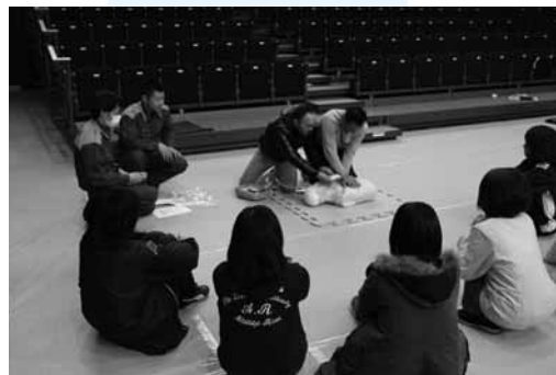
▶真剣に取り組む参加者の皆さん

これは、活動中に発生した事故等に適切に救命活動が行えるようにと企画されたもので、町内から指導者や保護者24名が参加。柳井消防署員の指導のもと、心肺蘇生法やAEDの取り扱いについて真剣に学びました。