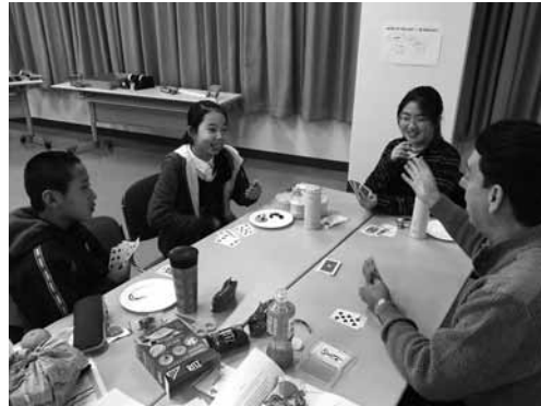
▲イングリッシュデイキャンプの様子

町内の中学生および高校生を対象としたイングリッシュキャンプに加えて、小学生を対象としたイングリッシュデイキャンプも実施します。また、小学校の低学年と中学年を対象とした英会話学習等を実施します。