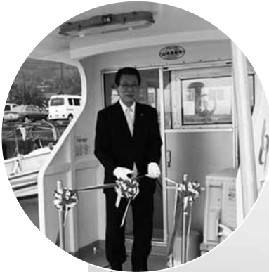
▲新造船を祝いテープカットを行う椎木町長