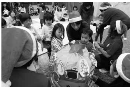
▲昨年開催された親子交流会(クリスマス会)の様子

コニコと笑顔で見つめている光景を目にして、とてもほえましく感じました。少子化時代の今日、子どもは宝です。子どもの笑顔は周りの人を幸せな気持ちにします。そしてお母さんの笑顔は、子どもにとって大切な心の栄養になります。私たち母推も笑顔で子育て中のお母さんの応援をしていきたいと思っています。いつでも気軽に声をかけてください。地域の皆さんも温かい見守りをお願いします。