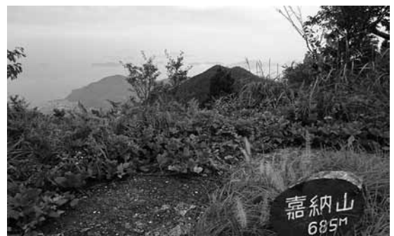
▲嘉納山山頂でランチをとりほっと一息。