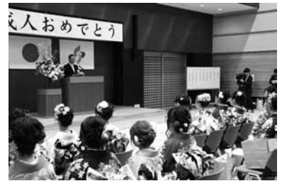
▲昨年度の成人式の様子