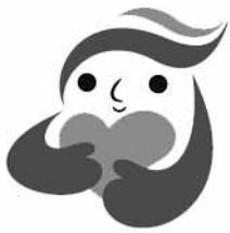
犯罪被害者等支援シンボルマーク「ギョっつとちゃん」