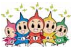
イメージキャラクター「エルレンジャー」

eLTAXは、地方税の手続きを、インターネットを利用して行うことができる便利なシステムです。