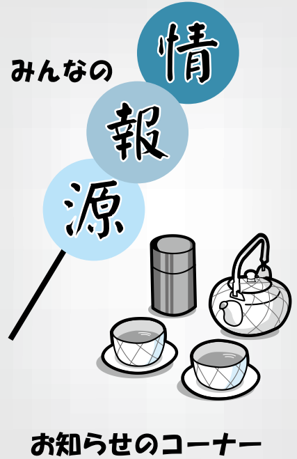
お知らせのコーナー