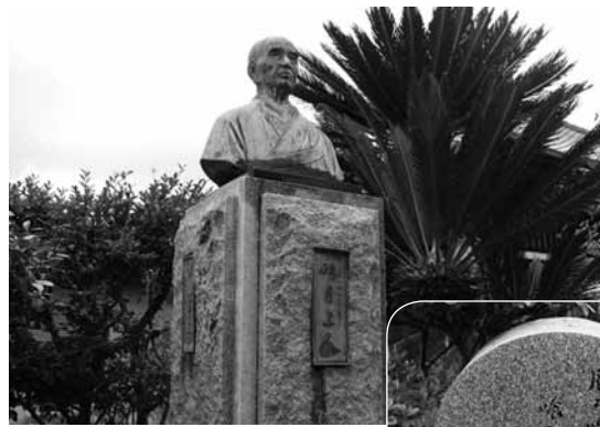
願行寺境内にある明月上人の銅像①と正岡子規が寄せた句の句碑②

頼まれれば額や石碑や寺の鐘の字や本のまえがきなど気安く引き受けた。町の人々は、「明月さん」と呼んで親しんだ。また散文づくりや書を通じて多くの友達がいた。