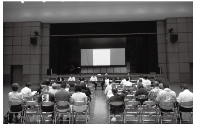
▲東和地区拡大大学校運営協議会（平成29年6月1日）

入学することを考慮して、平成31年度から、久賀中・東和中・安下庄中3校の部活動合同練習の実施を検討します。