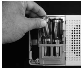
単2の電池（アルカリ電池 推奨）が4本必要です。

電池の交換が終わったら元に戻し、コンセントなどを確認してスイッチを入れます。赤色のランプが消えて緑色のランプが点灯していれば電池交換の終了です。