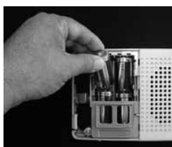
②単2の電池（アルカリ電池推奨）が4本必要です。

受信機の右側面のスイッチを切って、前面のふたを開け電池を入れ替えます。電池の交換が終わりましたら元に戻し、コンセントなどを確認してスイッチを入れます。前面の『乾電池』赤色のランプが消えて緑色のランプが点灯していれば電池交換の終了です。