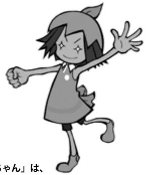
「みかんちゃん」は、周防大島町の3R推進マスコットキャラクターです。

分別されたごみは、リサイクルされるよ。「分ければ資源、混ぜればごみ」を合言葉に、ごみを正しく分別して、みんなで周防大島の環境を守ろうね。