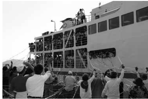
▲民泊した修学旅行生を伊保田港で見送る様子