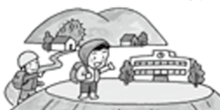
避難所・避難経路の確認

http://www.town.suo-oshima.lg.jp/soumu/dosya_saigai_1.html