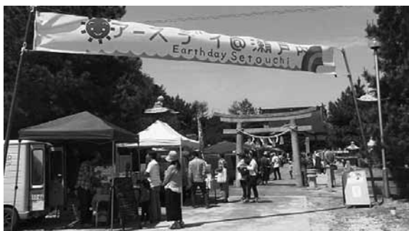
▲参道には19の出店ブースが並びました

が賑やかに並びました。心地よく降り注ぐ日差しの下、お客さんは境内にシートを敷いて音楽を聴きながらお弁当を食べたり、出店者の方とおしゃべりをしたり、海岸を散歩したり・・・ゆったりとした心地よい時間が流れ、飾らない周防大島らしいアースデイ、来年も開催されることを切に願います。 次回の海掃除は7月16日(日)午前8時から、三浦の中村漁港および海浜で西三浦地区の漁業関係者のみなさんと合同で行います。こちらは7月の毎週日曜に全県で実施する「やまぐちボランティア・チャレンジデー」の一環としてのイベントにもなっています。