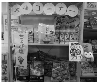
さくら薬局の減塩コーナー

橘地区にあるさくら薬局では、減塩コーナーを設置し減塩に役立つ様々な商品を手に入れることができるよう工夫されています。また、みかん薬局は、「元氣っちゃや！やまぐち減塩ライフ応援サポーター」に登録するなど、「ちよび塩」を応援する薬局も数多くあります。薬局は、薬の処方や薬に関する相談のほか、体調の変化や食事（栄養）・介護に関する相談など、健康に関する様々なサポートも行っています。健康管理や体力づくりの強い味方として、あなたの身近にある薬局を活用しませんか？