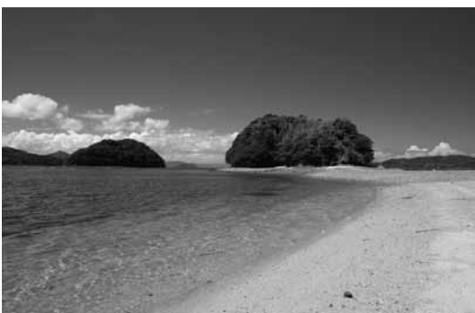
▲外国人にも人気の高い道の駅サザンセットうわの沖に浮かぶ真島島

一方で、その大きな変化を受けとめるには、私たち自身も成長していかなくてはなりません。島の一番の魅力は「ヒト」。旅先でのふれあいは何よりの思い出になるはず。オーラル周防大島による周防大島ならではの「おもてなし」で外国からのお客様をお迎えすることが、大きな経験として、これからの島の成長や自信そして財産になっていくのではないのでしょうか。