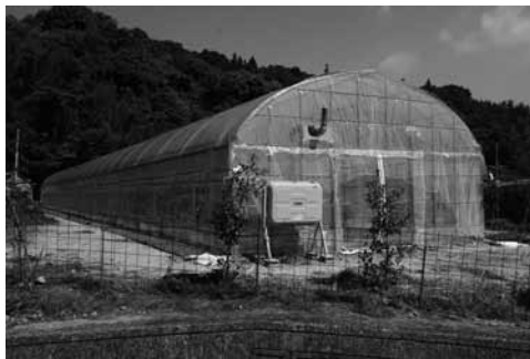
▲助成を受けて整備されたビニールハウス