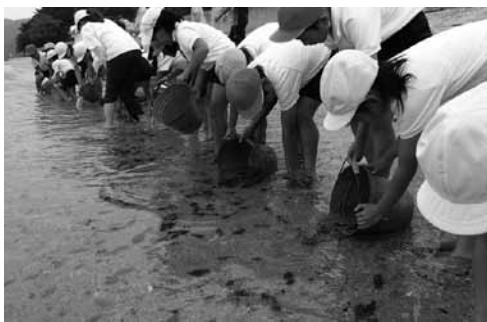
▲子どもたちの手によってヒラメの放流をしている様子

水産資源の保護育成と生産力の増強を目的として、各地先において稚魚や貝類の放流を継続して実施します。