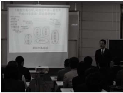
▲合同研修会の様子

4月6日に第1回中高合同研修会が行われました。この会では新着任者も含めた中高すべての教員が集まりました。全体会では昨年度の取組を踏まえ、今年度の目標や具体的な取組を全員で確認しました。次に教科ごとの教科部会に分かれ、今年度の交流授業の実施などの教科ごとの課題や取組についての協議を行いました。その後、分掌ごとの専門部会を行い、今年度の中高一貫教育のスタートをきりました。