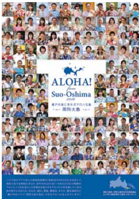
昨年作成したPRポスター

ハワイ州カウアイ島との姉妹島提携日（昭和38年6月22日）にちなんで、例年6月22日から官公庁や観光施設、金融機関などがアロハシャツを着用する「アロハビズ」。この時期に合わせて、毎年アロハシャツを新調される方もおられ、瀬戸内のハワイ・周防大島の夏の風物詩と言えるほど定着してきました。