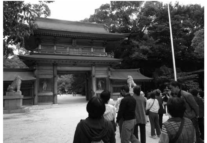
昨年度の生涯学習講座の様子

久賀公民館 ☎ 72 - 2271 F A X 72 - 0491 kukakyoi@town.suo-oshima.lg.jp