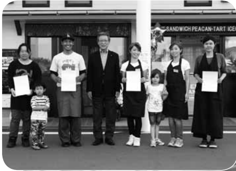
◀ 4月16日、オープンに先立ち椎木町長から認定証が手渡されました