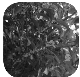
▲タイミンタチバナ