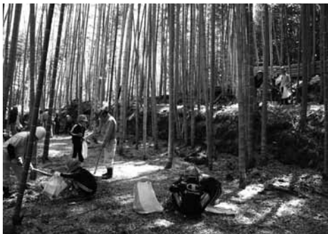
▶ 大人たちに助けってもらいながら袋いっぱいのタケノコを収穫しました