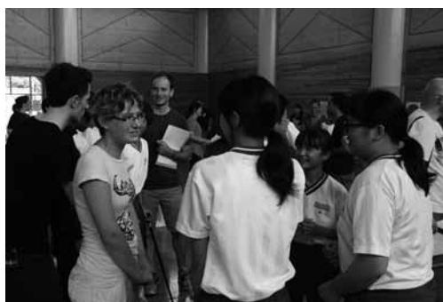
▲イングリッシュキャンプの様子

小中学校の児童生徒に基礎的・基本的な学習内容の定着を図り、学ぶ意欲や向上心を育てるため、漢検・数検・英検の検定料を全額助成します。