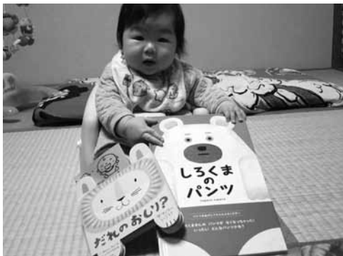
▲読み聞かせサポート事業

赤ちゃんを先天性風しん症候群から守るため妊娠予定者、パートナーおよび同居家族に対して抗体検査およびワクチン接種費用の一部を助成します。