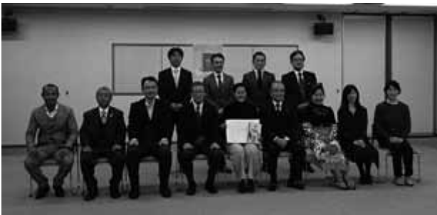
▲発表を終えほっとした様子の発表者と審査員

は綿花の栽培、機織り教室の開催、商品開発と販売を目指されます。実際にご自身で織った優しい色合いの綿布をお持ちになり、発表された熱いプレゼンには吸い込まれるものがありました。 発表者の中には既に起業に向けて具体的に取り組まれている方もいらっしゃいます。これから新しいビジネスを周防大島で見つけたらプランコンペの参加者かもしれません。みなさんの温かい応援をよろしく願います。 さて、今回の海掃除は6月17日(土)午後5時から立岩海水浴場です。島時々半島ツアー参加のみなさんと一緒におしゃべりしながらゆるりと海掃除をしてくださる方大募集です。