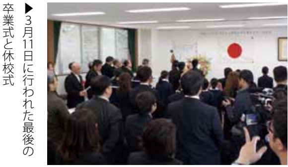
▶ 3月11日に行われた最後の卒業式と休校式