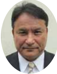
児童養護施設あけぼの寮

より、これまでに700名以上の退寮生を輩出してきました。ここまで情島では、子ども達に、人と人、人と地域のつながりを強くする「つながる力」を長い歴史の中で育んでいただきました。