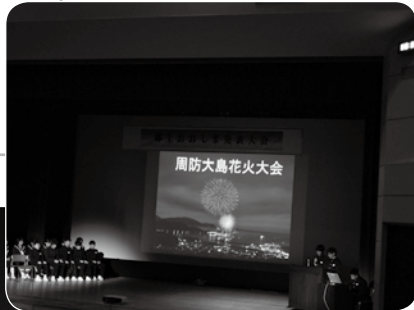
▲安下庄中学校の発表