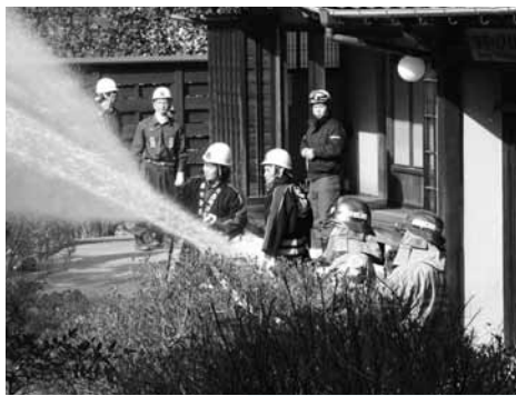
日本ハワイ移民資料館（上）と沖家室島での放水訓練の様子

文化財防火デーの一環として、1月25日に西屋代にある日本ハワイ移民資料館、1月29日には沖家室島で消防訓練が行われました。両地区あわせて消防団員や地域住民ら約200人が訓練に参加。被害を最小限に留めるためのバケツリレーや初期消火訓練など真剣に取り組みました。