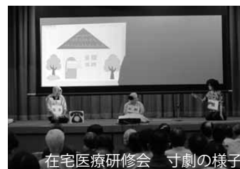
在宅医療研修会 寸劇の様子