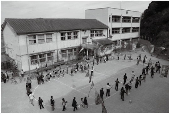
▲みんなで踊った“最後の”大島音頭