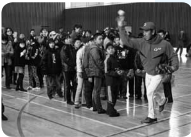
◀倉さんのキャッチボール教室も行われました