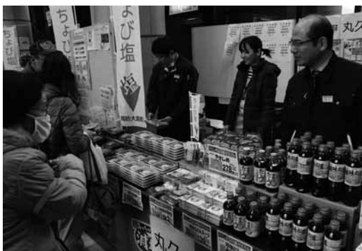
▲減塩商品がズラリ。減塩への関心は高く様々な減塩商品が開発されています

1月29日に「ちよび塩ミニサミット in 周防大島」を大島文化センターで開催し、会場は大勢の来場者で賑わいました。当日は、講演会の他、減塩メニューの試食コーナーやJ-A山口大島のちよび塩弁当、地元パン屋ワンハートのちよび塩パン、丸久による減塩商品が販売されました。また、地元の旬の野菜や果物、特産品も数多く並び、企業や団体が会場を盛り上げ、ちよび塩を『見て、聴