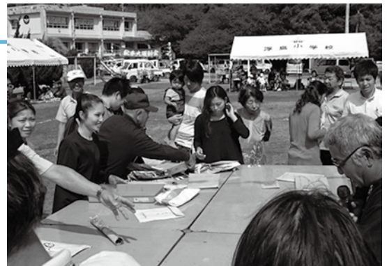
▲思い出の品に目を向ける当時の児童・保護者

また、島内の方の品も収められており、20年という時の流れを感じつつ、思い出の品を目の当たりにし、目頭を熱くされた人もいました。このように、島唯一の小学校が、島民の心の拠り所になっていることを実感した一日となりました。