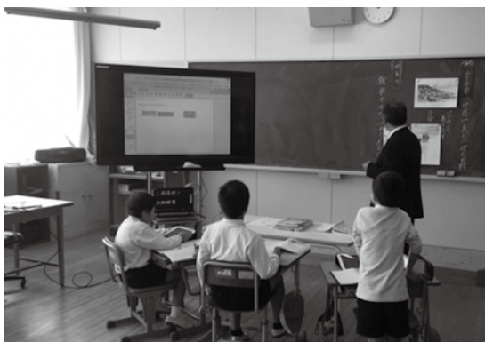
電子黒板やタブレットを使った授業風景