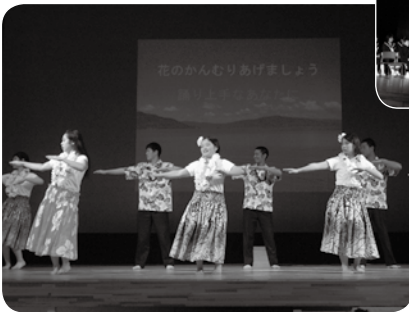
◀周防大島高校フラの実演

があるハワイの文化を学び、フラを披露するなど新たな取り組みを知っていただくことができました。 この大会を契機に、地域の方の優しさや温かさなどに触れながら、地域への愛情を育むことができました。また、各校がお互いの発表を見ることにより、「郷土おおしま」について、知識と理解を深めるよい大会となりました。