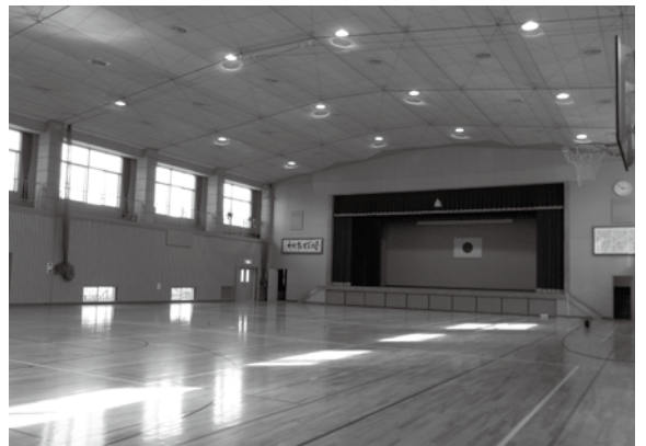
改修を終えた久賀中学校の屋内運動場

これで、天井等落下防止対策が必要とされた町内小中学校の屋内運動場の改修は全て完了しました。