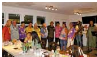
▲山口に縁を持つ方との交流