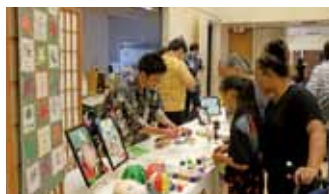
▲カウアイ日本文化祭に参加