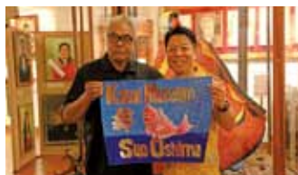
▲カウアイミュージアム訪問