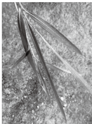
(写真2) タイミンチク

『東和町の植物』ではリュウキュウチクとしていた。リュウキュウチクの園芸品種であるが、現在はタイミンチクとされている。社に向かっ