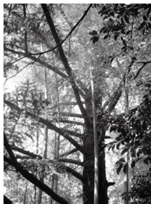
(写真1) ウラジロモミ

て左側に群生しており、葉身の上面が下や横を向いたり、よじれたりしている。県内や近県での記録は見当たらない。 この社叢にはその他、ホテイチク(ゴサンチク)、ゲツケイジュ、サザンカ、マテバシイなどが見られる。昔はカラマツ、エドヒガン、サツキ(大木)などもあった。現在では特に(1)と(3)が貴重で、将来にわたって残したい社叢である。