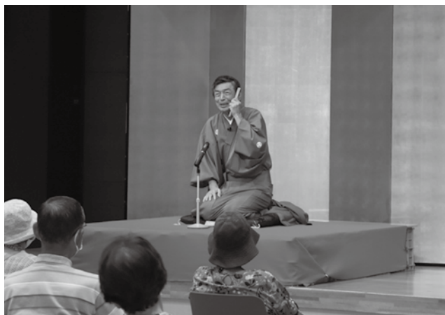
▲由宇亭拓の輔さんによる「詐欺防止落語」