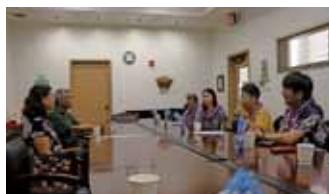
▲カウアイコミュニティカレッジ訪問