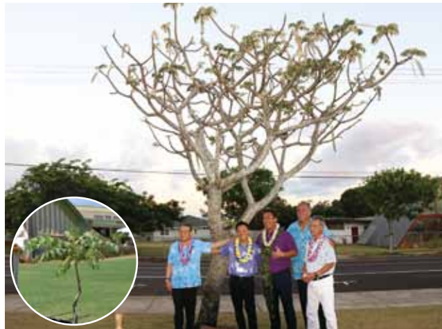
▲姉妹島提携40周年（平成15年）に友好の証として植樹された記念樹。交流を重ねるごとに大きく成長

カウアイ島にて姉妹島提携50周年記念式典を開催。両島の代表者4人が姉妹島交流確認書に署名。