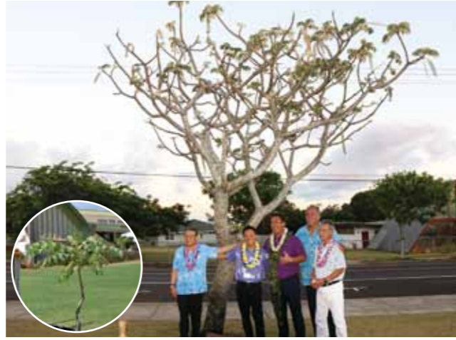
▲姉妹島提携40周年（平成15年）に友好の証として植樹された記念樹。交流を重ねるごとに大きく成長