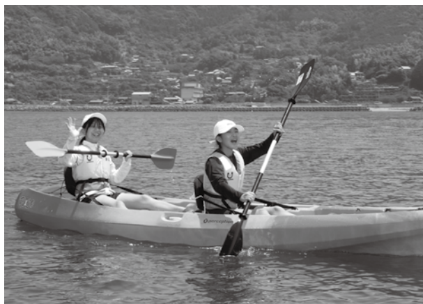
▲彦島を目指してカヌーを漕ぐ大島中学校の生徒さん

生徒たちは、カヌーの練習を行った後、艇庫から約1km離れた彦島の区間を往復。カヌー以外にも、服を着たまま水に浮かぶ着衣泳を学んだほか、水上バイクによるレスキューや海洋スポーツのSUPを体験しました。