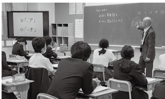
▲高校の教頭が中学校で授業を行っている様子

こうした交流を通じて、中高生それぞれが学力を高められるよう、教員の資質向上に努めています。