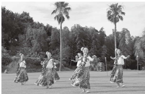
▲芝生をステージに素敵なフラを披露する参加チーム