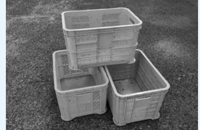
▲人気の高いコンテナ

動噴、草刈り機、チェーンソー、コンテナ、各種資材 ※不動産・破損品は対象外です。