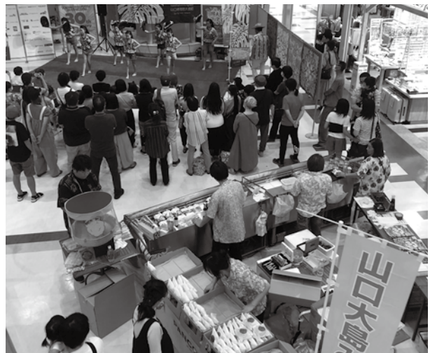
▲周防大島フェアの様子

では、久しぶりの大型催事ということで慣れない点もありましたが、出店者ならびにスタッフが丸となり周防大島のPRに努めることができました。来年度も周防大島観光協会の会員店舗さんのご協力を得て、このような町外開催のイベントにチャレンジしていきたいと思っております。