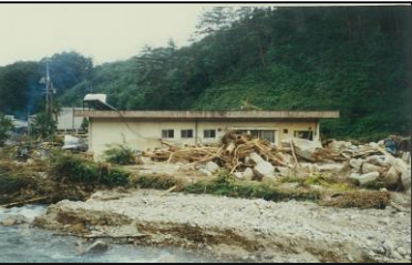
写真：過去の決壊事例

近年の集中豪雨により、ため池災害が発生しており、また災害に至らなくても非常に危険な状態になり、下流域の住民が避難を余儀なくされる事態が発生しています。この様なことから、大雨によりため池が決壊するといった最悪の事態を想定し、決壊による浸水被害想定と避難対策等の情報をわかりやすく住民の皆さんに提供することを目的に作成したものです。