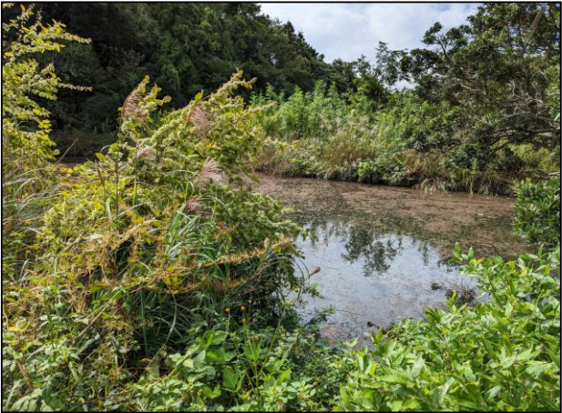
写真：中山ため池（上流より撮影）

近年の集中豪雨により、ため池災害が発生しており、また災害に至らなくても非常に危険な状態になり、下流域の住民が避難を余儀なくされる事態が発生しています。この様なことから、大雨によりため池が決壊するといった最悪の事態を想定し、決壊による浸水被害想定と避難対策等の情報をわかりやすく住民の皆さんに提供することを目的に作成したものです。