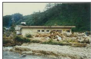
写真：過去の決壊事例

この様なことから、大雨によりため池が決壊するといった最悪の事態を想定し、決壊による浸水被害想定と避難対策等の情報をわかりやすく住民の皆さんに提供することを目的に作成したものです。