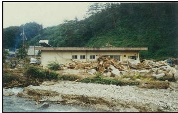
写真：過去の決壊事例

近年の集中豪雨により、ため池災害が発生しており、また災害に至らなくても非常に危険な状態になり、下流域の住民が避難を余儀なくされる事態が発生しています。この様なことから、大雨によりため池が決壊するといった最悪の事態を想定し、決壊による浸水被害想定と避難対策等の情報をわかりやすく住民の皆さんに提供することを目的に作成したものです。