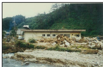
写真：過去の決壊事例

近年の集中豪雨により、ため池災害が発生しており、また災害に至らなくても非常に危険な状態になり、下流域の住民が避難を余儀なくされる事態が発生しています。この様なことから、大雨によりため池が決壊するといった最悪の事態を想定し、決壊による浸水被害想定と避難対策等の情報をわかりやすく住民の皆さんに提供することを目的に作成したものです。