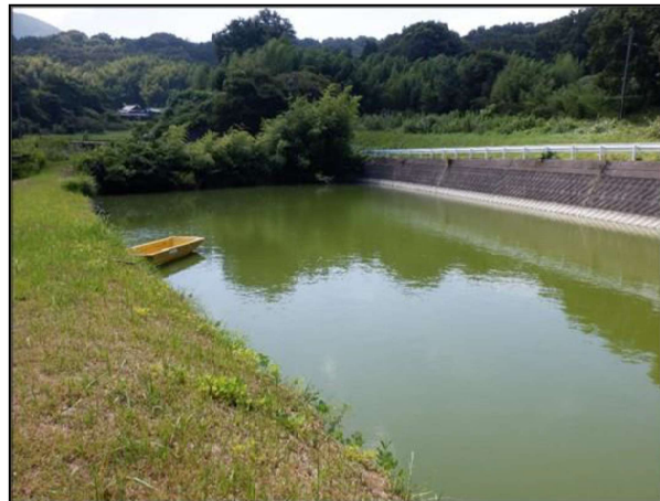
写真：代の田ため池